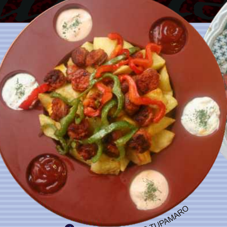
↑ TABLA DE PATATAS TUPAMARO