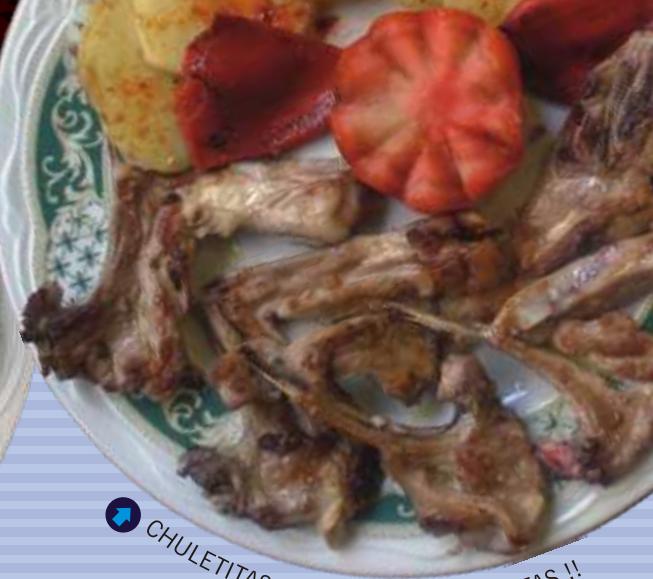
↑ CHULETITAS DE LECHAL !! EXQUISITAS !!