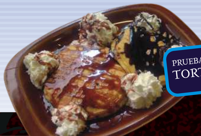
← PRUEBA NUESTRAS DELICIASAS TORTITAS CON NATA !! EXQUISITAS !!