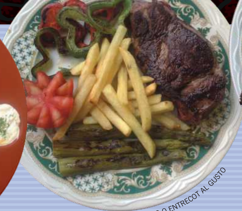
↑ SOLOMILLO O ENTRECOT AL GUSTO