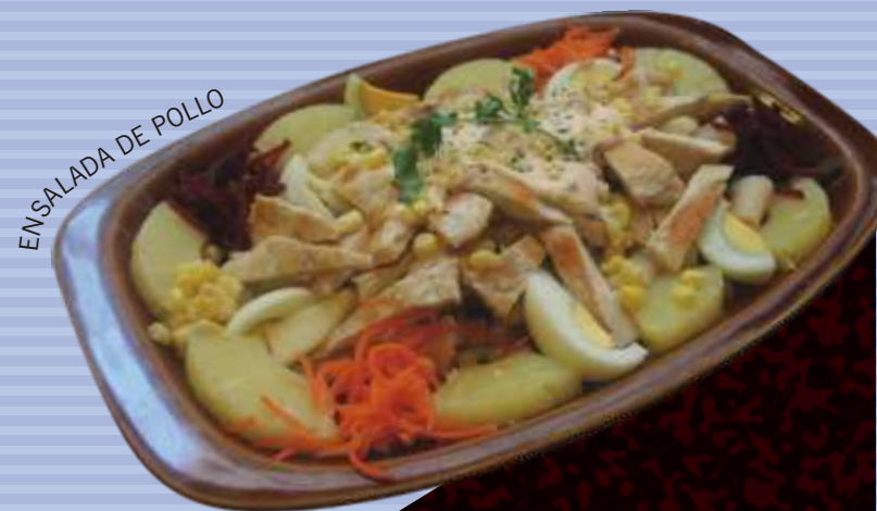
ENSALADA DE POLLO